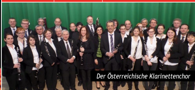
Der Österreichische Klarinettenchor